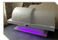
Dôme infrarouge 35 € la séance 150 € les 5 séances 250 € les 10 séances