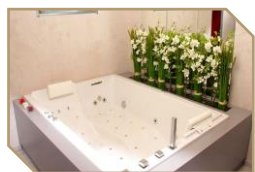
Baignoire Balnéo Pour deux personnes 25 € la séance

Le Spa du Causse Comtal vous propose sa carte de soins autonomes, pour vos courtes sessions de plaisir et de détente.