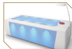
Lit hydro-massant Pour une personne 19 € la séance