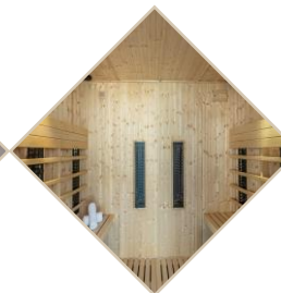
Sauna infrarouge 6 places