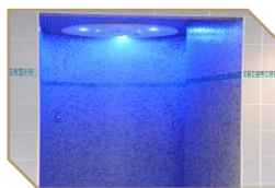
Douche sensorielle Pour une personne 19 € la séance